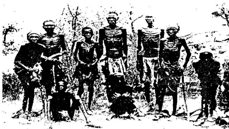
Histoire 3 e : l'Afrique et le Monde ; Hatier ; paris ; 1995