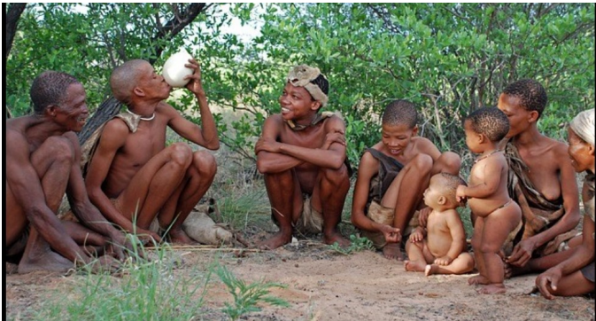
DOCUMENT 2 : Une image des peuples bororos

CONSIGNE : À l'aide des documents et de tes propres connaissances,éffectue les tâches suivantes.