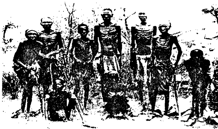
Histoire 3 e : l'Afrique et le Monde ; Hatier ; paris ; 1995