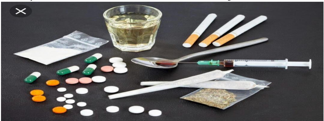
Document extrait de ce documentaire

Te sachant élève de première D et persuadé que tu es mieux armé(e) que lui sur ce sujet, il te sollicite donc pour lui apporter d'amples informations et l'aider à combattre ce fléau dans votre entourage.