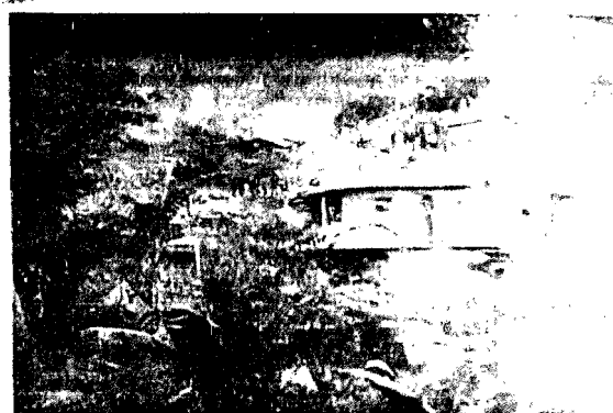
Drame du quartier Gouachou