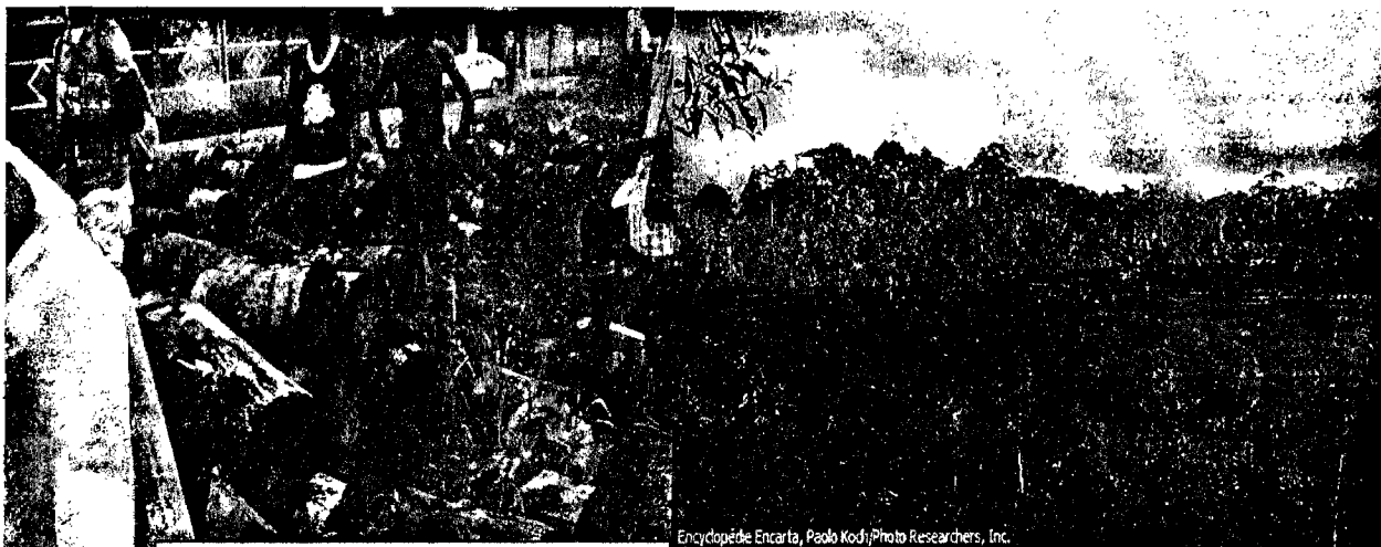
Document2 : Forêt secondaire en plein essor