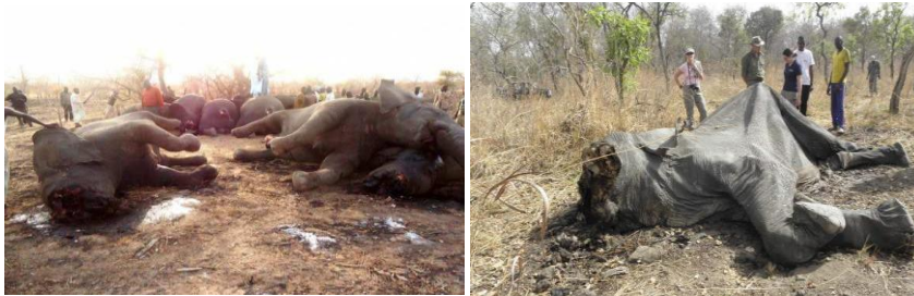
Le massacre de plus de 200 éléphants dans le parc de Bouba Ndjidda par des braconniers d'origine soudanaise