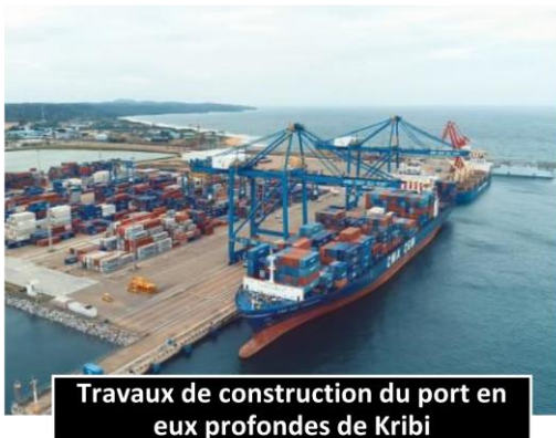
Travaux de construction du port en eux profondes de Kribi